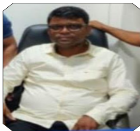
आजाद खान (कांदिवली)

गौरतलब है कि आयल मार्केटिंग कंपनीस (ओएमसी) के नियमों को ताक पर रखकर देश की बहुराष्ट्रीय तेल कंपनियों के जनरल मैनेजर (एलपीजी), ट्रांसपोर्ट मैनेजर (टी.एम.) और मार्केटिंग मैनेजर (एम. एम.) के आलावा राशनिंग विभाग के अधिकारियों ने धन उगाही का नया तरीका इजाद किया है। इसके तहत सही को गलत और गलत को सही करने में लगे हैं। चूंकि इन अधिकारियों की मिली भगत के बीना कोई भी एजेंसी या विक्रेता एलपीजी रसोई गैस एवं व्यावसायिक सिलेंडरों में हेराफेरी या झोल नहीं कर सकता। यहां