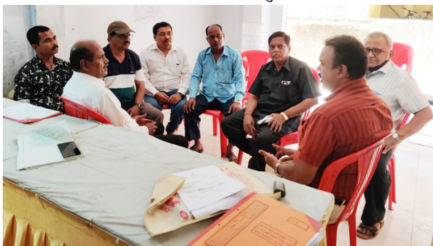
बामर लॉरी के कर्मचारियोंकी महाराष्ट्र क्राइम्स के प्रतिनिधि के साथ चर्चा.

तैयारी है तो आपको फिर से काम पर लिया जाएगा, ऐसा झूठा आश्वासन दिया गया। उस समय निष्कासित कर्मचारियों ने कंपनी में किसी भी प्रकार के काम की तैयारी दशायी थी।