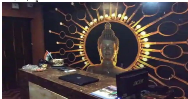
यही है देह व्यापार का मुख्य अड्डा इलाइट द फॅमिली स्पा एंड सलून स्पा